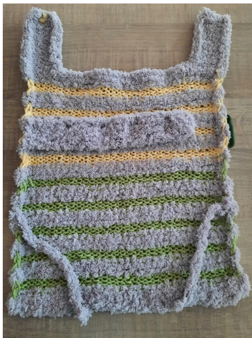
1. fotó háta